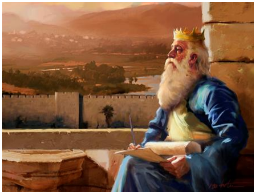
Vua San-Môn (Sa-Lô-Môn)\]