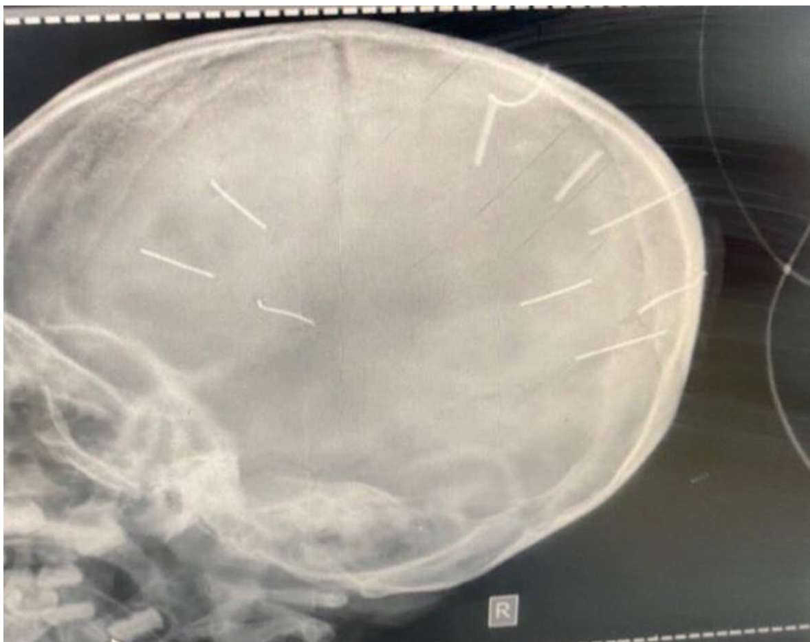
Hình ảnh chụp X-quang hộp sọ bệnh nhi -