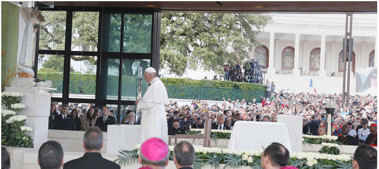
[ May 13 2017 ĐTC kính viếng Đức Mẹ Fatima. Tượng Đức Mẹ được đặt nơi Mẹ đã đứng. Cây sồi phía sau là một nhánh nhỏ của cây mẹ ]

Mong rằng những lời trao đổi ngắn ngủi trên lược tóm các điều chính mà Đức Mẹ đã chỉ dạy cho ba em bé trong sáu lần hiện ra là cải thiện đời sống, cầu nguyện cho kẻ có tội biết ăn năn, siêng năng lần hạt.